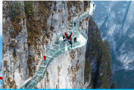
ระเบียงทางเดินเลียบบหน้าผา

วันที่สาม จางเจียเจี้ย-ศูนย์สมุนไพรจีน-ผลิตภัณฑ์ยางพารา- กระเช้าขึ้น/ลงเขาเจ็ดดาว – ระเบียงชมวิว Sky Eye - ระเบียงทางเดินเลียบบหน้าผา – (เลือกซื้อโปรแกรมเสริม โชว์จิ้งจอกขาว)