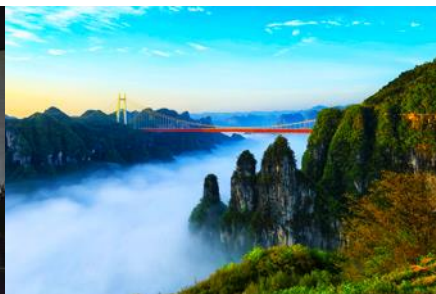
อุทยานป่าไม้แห่งชาติไฉ่จ้าย