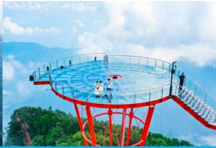
ระเบียงชมวิว Sky Eye