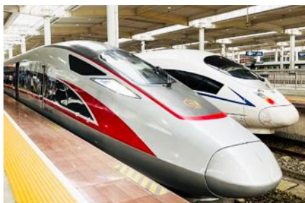
บั้งรถไฟความเร็วสูง

https://hk.trip.com/hotels/guzhang-hotel-detail-68614854/chaxitai-holiday-hotel/