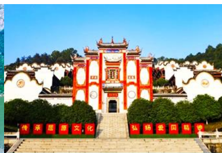
บ้านเกิดกวี ชวีหยวน