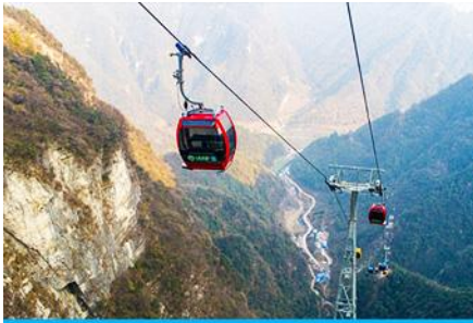
กระเช้าขึ้น/ลงเขาเจ็ดดาว