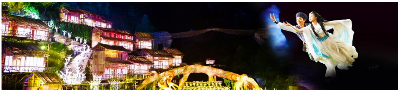
The Love Story of a Wooden Man and Fairy fox