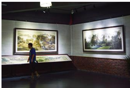
พิพิธภัณฑ์ภาพหินทราย

พักที่ ZHENMIN HOTEL โรงแรมระดับ 4 ดาวหรือเทียบเท่า