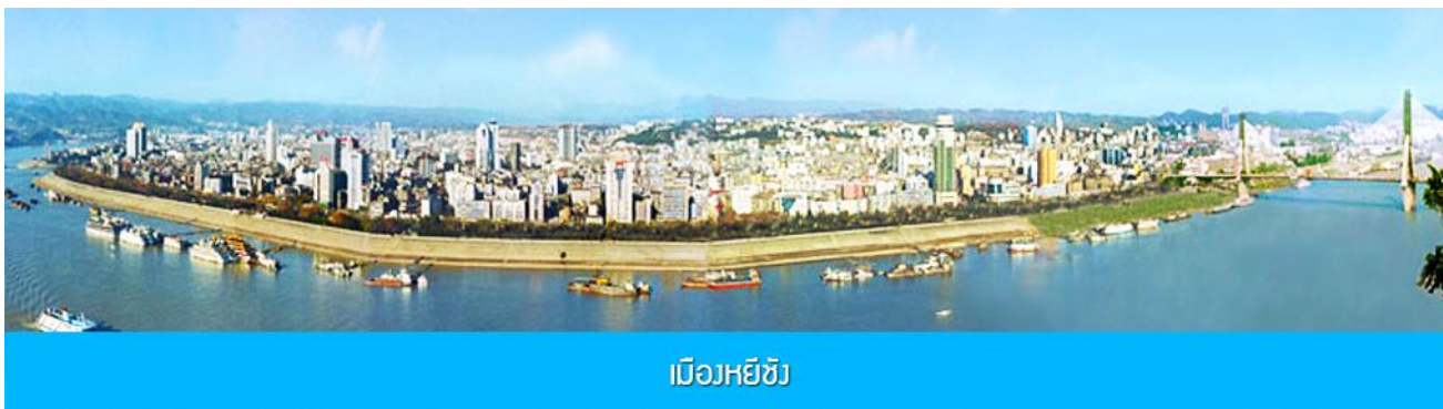
เมืองหยีซัง