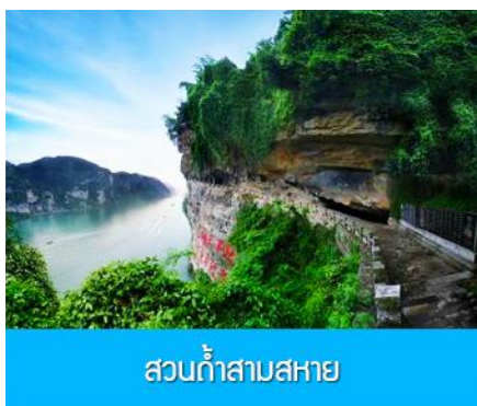
สวนถ้ำสามสหาย