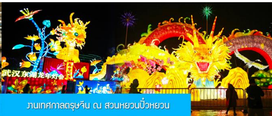
งานเทศกาลตรุษจีน ณ สวนหยวนปี้หววน

วันที่ห้า เมืองจางเจียเจี๋ย – เมืองเก็งจิว – นั้รถไฟความเร็วสูงสู่นครหวู่ฮั่น – เที่ยวงานฉลองเทศกาลตรุษจีน ร่วมงานเลี้ยงอาหารค่ำต้อนรับของทางการมณฑลหูเป่ย์ – นั้รถไฟความเร็วสูงกลับเมืองหยีซัง