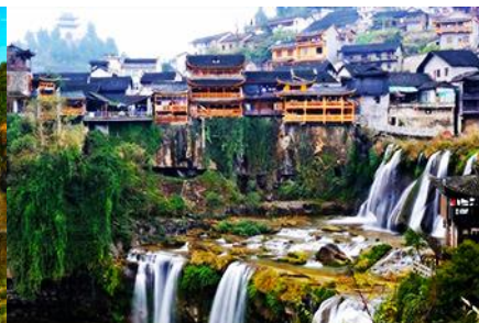
เมืองโบราณผู่หรงเจิ้น

วันที่ 1 จางเจี๋ยเจี๋ย-พิพิธภัณฑ์ภาพหินทราย – ศูนย์จำหน่ายผลิตภัณฑ์ทางพารา-อุทยานไฉ่จ้าย-เมืองโบราณผู่หรงเจิ้น