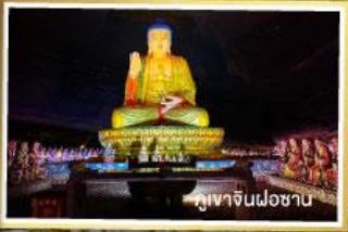
พุทธรูปจินฝอซาน