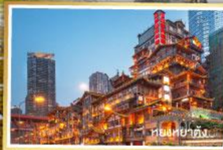
หนิงเซี่ยกั๋ง