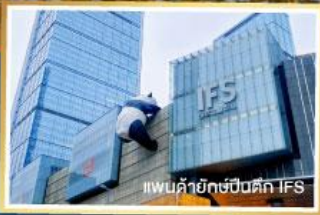
แพนค้ายักษ์บีนตัก IFS