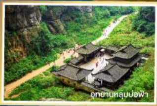
อุทยานหลุมง้อฟ้า