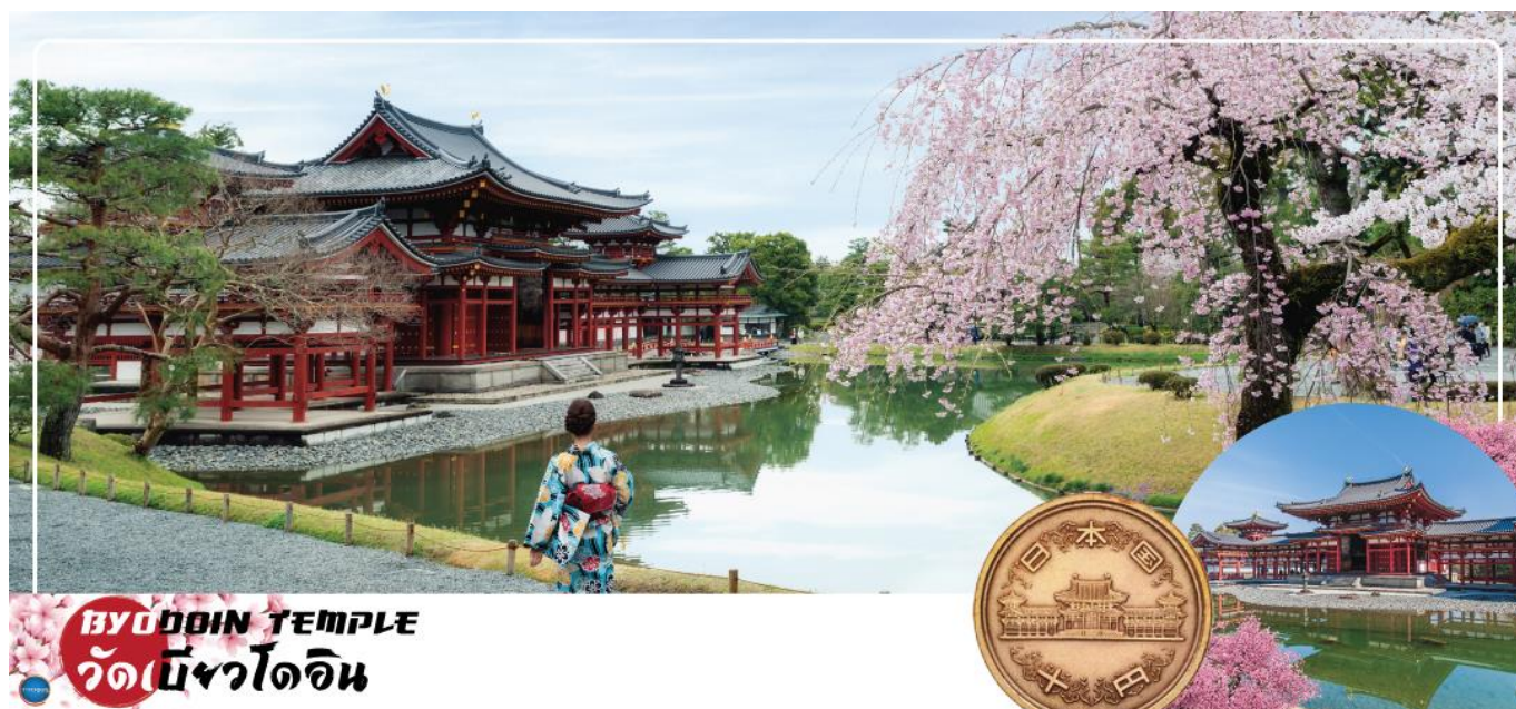
BYODOIN TEMPLE วัดเบียวโดอิน

วันที่สอง ท่าอากาศยานนานาชาติคันไซ โอซาก้า ประเทศญี่ปุ่น – เมืองเกียวโต – เมืองอุจิ – วัดเบียวโดอิน (จุดชมซากุระขึ้นกับภูมิภาค) – ถนนเบียวโดอิน โอมโตะซันโด (ถนนชาเขียว) – สะพานอุจิ – เมืองนาโงย่า – ซ้อปปิงย่านซาคาเอะ