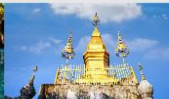
พระธาตุพูสี