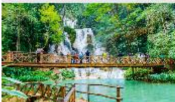
น้ำตกตาดกวาสี