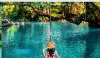
บลูลากูน