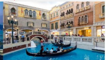
เวเนเซียน

*ทางบริษัทฯ ขอสงวนสิทธิ์ในการสลับโปรแกรมทัวร์ตามความเหมาะสมขึ้นอยู่กับสถานการณ์หน้างาน โดยคำนึงถึงผลประโยชน์ของลูกค้าเป็นสำคัญ