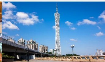
กวางเจาทาวเวอร์