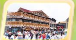
ภูเขาไฟฟูจิชั้นที่ 5