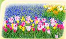
สวนดอกไม้ฮามามัตสึ