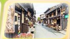
ย่านทาคายาม่า