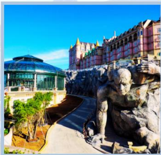
เฑอ Eclipse Square