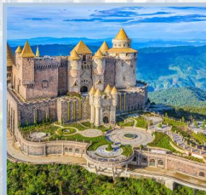
ปราสาทจันตรา