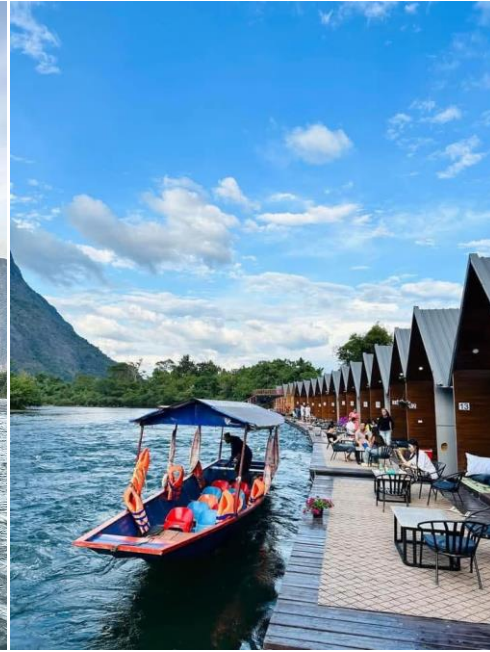
พักที่ แพริเวอร์ไซด์ 2 หรือเทียบเท่า