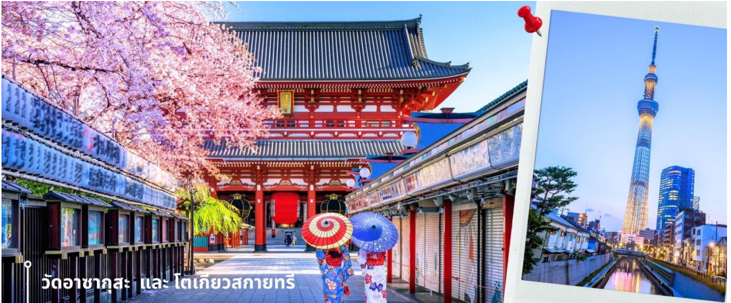
วัดอาซากุสะ และ โตเกียวสกายทรี

นำท่านขึ้นรถโค้ชปรับอากาศ จากนั้นเดินทางสู่ เมืองโตเกียว พาท่านสักการะ ที่ วัดอาซากุสะ Asakusa Temple วัดที่ได้ชื่อว่าเป็นวัดที่มีความศักดิ์สิทธิ์และได้รับความเคารพนับถือมากที่สุดแห่งหนึ่งในกรุงโตเกียวภายในประดิษฐานองค์เจ้าแม่กวนอิมทองคำที่มักจะมีผู้คนมาราบไหว้ขอพรเพื่อความเป็นสิริมงคลตลอดทั้งปีประกอบกับ