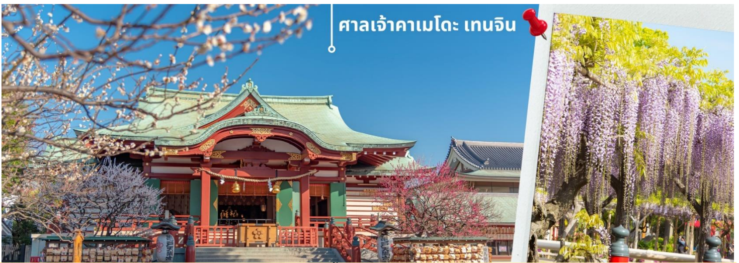
ศาลเจ้าคาเมโตะ เทนจิน

หลังจากนั้นจากนั้นนำท่านเดินทางสักการะ ขอพรกันที่ ศาลเจ้าคาเมโตะ เทนจิน Kameido Tenjin Shrine เป็นศาลเจ้าที่ตั้งอยู่เมืองโตเกียว ศาลเจ้าแห่งนี้สร้างขึ้นกว่า 350 ปี เพื่ออุทิศให้แก่นักปราชญ์ชื่อดังของญี่ปุ่นสุกาวะระโนะ มิจิซานะ ศาลเจ้าแห่งนี้ขึ้นชื่อว่าเป็นสถานที่ยอดนิยมสำหรับนักท่องเที่ยวทั้งต่างชาติและนักท่องเที่ยวชาวญี่ปุ่น เนื่องจากเป็นสถานที่สำคัญในไหว้ขอพรเพื่อความเป็นสิริมงคลแล้ว รวมถึงเรียนรู้ประวัติศาสตร์ผ่านศิลปะแล้วนั้น ภายในศาลเจ้าแห่งนี้ยังมีทิวทัศน์ทางธรรมชาติที่สวยงามของดอกวิสทีเรีย ที่มีความโดดเด่นที่สะพานโค้งสีแดงกลางสระน้ำ สำหรับชาวญี่ปุ่น ดอกวิสทีเรีย(Wisteria) เป็นดอกไม้สำคัญอีกชนิดหนึ่งรองจากซากุระ โดยจะออกดอกสีม่วง