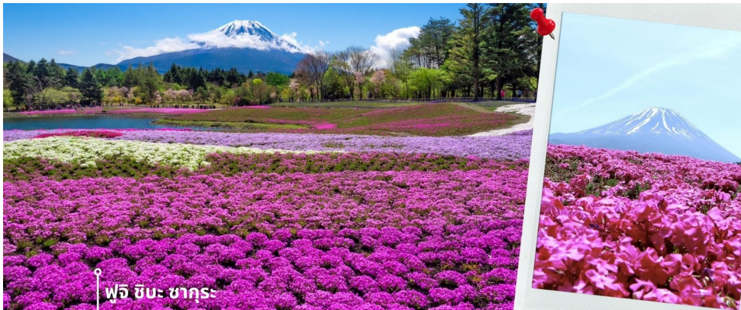
ฟูจิ ซิบะ ซากุระ

พอสมควรกับเวลา ทะเลสาบคาวากูจิโกะซากุระ (Lake Kawaguchiko) ในจังหวัดยามานาชิ แหล่งท่องเที่ยวที่อยู่ไม่ไกลจากโตเกียว (Tokyo) หนึ่งในที่เที่ยวยอดนิยมตลอดกาล ทะเลสาบที่กว้างใหญ่เป็นอันดับ 2 ของ 5 ทะเลสาบรอบภูเขาไฟฟูจิ อยู่บริเวณเชิงภูเขาไฟ ความสูงกว่าระดับน้ำทะเลประมาณ 800 เมตร ทำให้สภาพอากาศบริเวณนี้เย็นสบายตลอดปี รายล้อมไปด้วยธรรมชาติที่อุดมสมบูรณ์ และทิวทัศน์สวยงามตลอดปี และเดินทางต่อไปที่ สวนโออิชิพาร์ค Oishi Park เป็นสวนสาธารณะริมทะเลสาบคาวากูจิโกะ บริเวณด้านในสวนท่านยังสามารถชมความงามของดอกไม้ต่างๆได้ตามฤดูกาล ด ให่ท่านได้เดินชมความสวยงามและเก็บภาพความประทับใจ