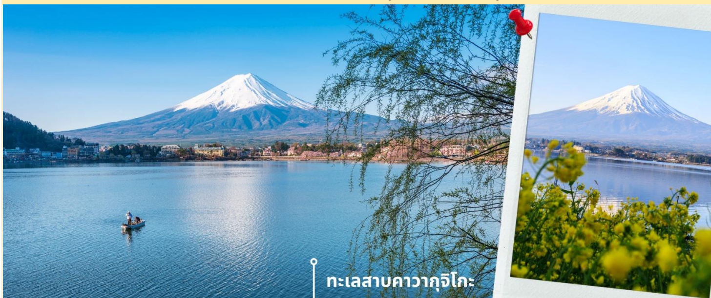
ทะเลสาบคาวากูจิโกะ

**ระยะเวลาการบานของดอกไม้ขึ้นอยู่กับสายพันธุ์และฤดูกาล**