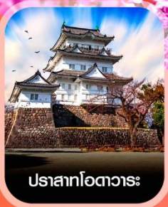
ปราสาทโอตาวาระ