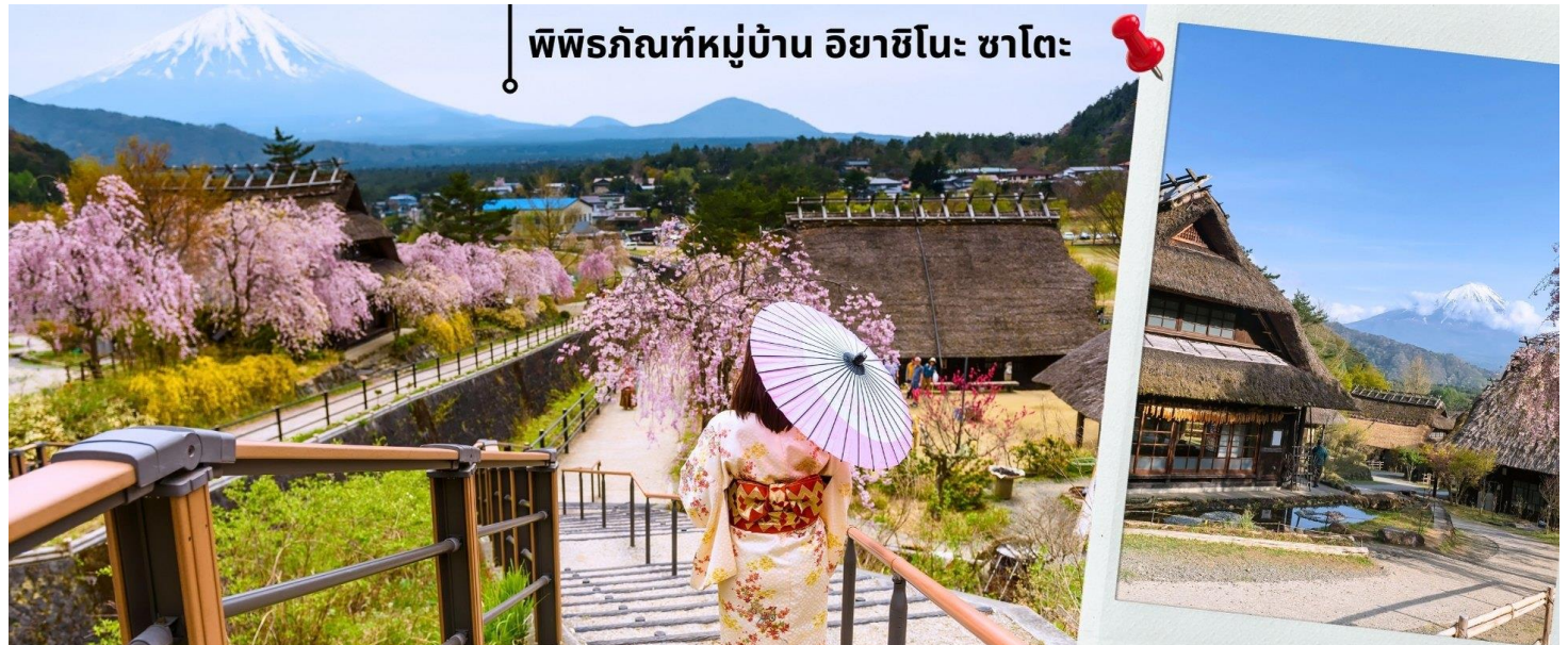
พิพิธภัณฑ์หมู่บ้าน อียาชิโนะ ซาโตะ

หลังรับประทานอาหารเช้า นำท่านเดินทางเข้าชม พิพิธภัณฑ์หมู่บ้านอียาชิโนะซาโตะ Saiko Iyashi No Sato ซึ่งตั้งอยู่บริเวณฝั่งตะวันตกของทะเลสาบไซโกะ เป็นหมู่บ้านโบราณที่ได้รับการบูรณะและฟื้นฟูขึ้นมาใหม่หลังจากถูกทำลายโดยพายุไต้ฝุ่นในปี 1966 ปัจจุบันกลายเป็นพิพิธภัณฑ์กลางแจ้งที่มีเอกลักษณ์ที่ผสมผสานประวัติศาสตร์ วัฒนธรรม และทัศนียภาพธรรมชาติอันงดงามเข้าด้วยกัน ให้ท่านได้สัมผัสวิถีชีวิตดั้งเดิมของชาวญี่ปุ่นในยุคโบราณ ท่ามกลางวิวภูเขาไฟฟูจิที่งดงาม และไฮไลท์ของการเที่ยวพิพิธภัณฑ์หมู่บ้านอียาชิโนะซาโตะ คือตลอด 2 ข้างทางจะมีต้นซากุระขึ้นเรียงรายยิ่งทำให้ช่วยเพิ่มความสวยงามให้กับบรรยากาศโดยรอบบ้านที่หลังคามุงฟางรับกับวิวภูเขาไฟฟูจิเก็บไว้เป็นที่ระลึก