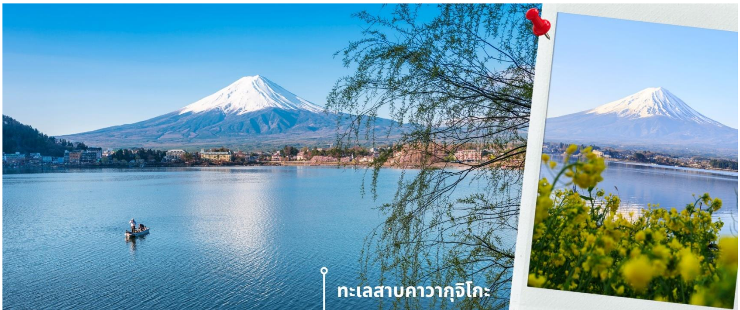
ทะเลสาบคาวากุจิโกะ

หลังรับประทานอาหารเช้า นำท่านแวะชม พิพิธภัณฑสถานแผ่นดินไหว เป็นพิพิธภัณฑสถานี่แสดงถึงผลกระทบจากภัยพิบัติแผ่นดินไหวและการระเบิดของภูเขาไฟ ภายในพิพิธภัณฑสถานมีห้องจัดแสดงข้อมูลการประทุของภูเขาไฟจากทุกมุมโลก โชนความรู้ต่างๆและโชนข้อปั้งสินค้าญี่ปุ่นอาทิเช่น ผลิตภัณฑ์เครื่องสำอางและของฝากอีกมากมาย พอสมควรแก่เวลานำท่านเดินทางสู่ ทะเลสาบคาวากุจิโกะ (Lake Kawaguchiko) ในจังหวัดยามานาชิ แหล่งท่องเที่ยวที่อยู่ไม่ไกลจากโตเกียว (Tokyo) หนึ่งในที่ที่วิวญี่ปุ่นยอดฮิตตลอดกาล ทะเลสาบที่กว้างใหญ่เป็นอันดับ 2 ของ 5 ทะเลสาบรอบภูเขาไฟฟูจิ อยู่บริเวณเชิงภูเขาไฟ ความสูงกว่าระดับน้ำทะเลประมาณ 800 เมตร ทำให้สภาพอากาศบริเวณนี้เย็นสบายตลอดปี รายล้อมไปด้วยธรรมชาติที่อุดมสมบูรณ์ และวิวทัศนสวยงามตลอดปี ในช่วงเวลาที่พลาดไม่ได้เลยที่จะได้ชื่นชมดอกซากุระบาน คือในช่วงปลายเดือนมีนาคมจนถึงต้นเดือนเมษายน จะบานสะพรั่งสวยงามเรียงรายริมทะเลสาบสามารถชมวิวดูทั้งทะเลสาบและภูเขาไฟฟูจิได้อย่างชัดเจน นับเป็นจุดชมซากุระยอดฮิตที่สุดอีกแห่งหนึ่งในญี่ปุ่น