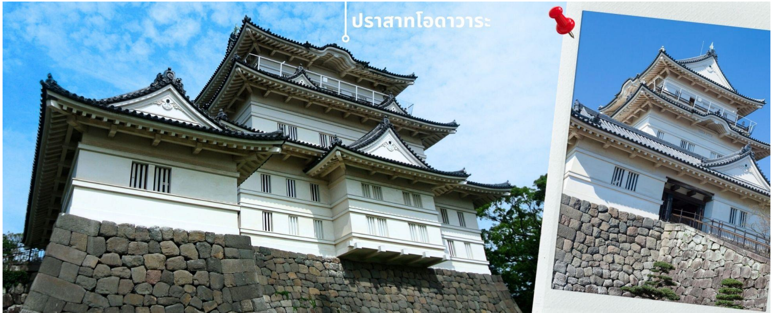
ปราสาทโอดาวาระ

☎ 02 254 9334-8 | ✉ Info@tourpro.co | 🌐 www.Tourpro.co | 📞 @tourpro.co