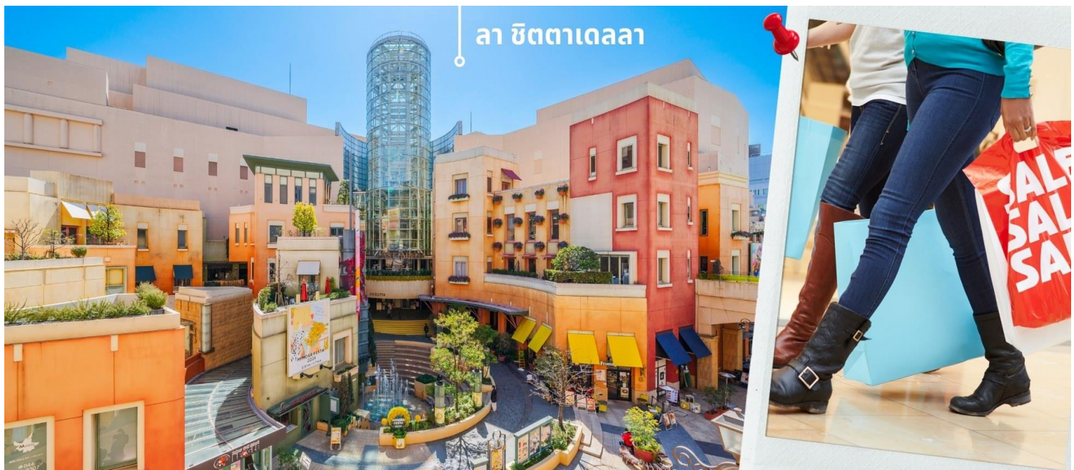
ลา ซิตตาเดลลา

เที่ยง รับประทานอาหารเที่ยง ณ ภัตตาคาร (7)