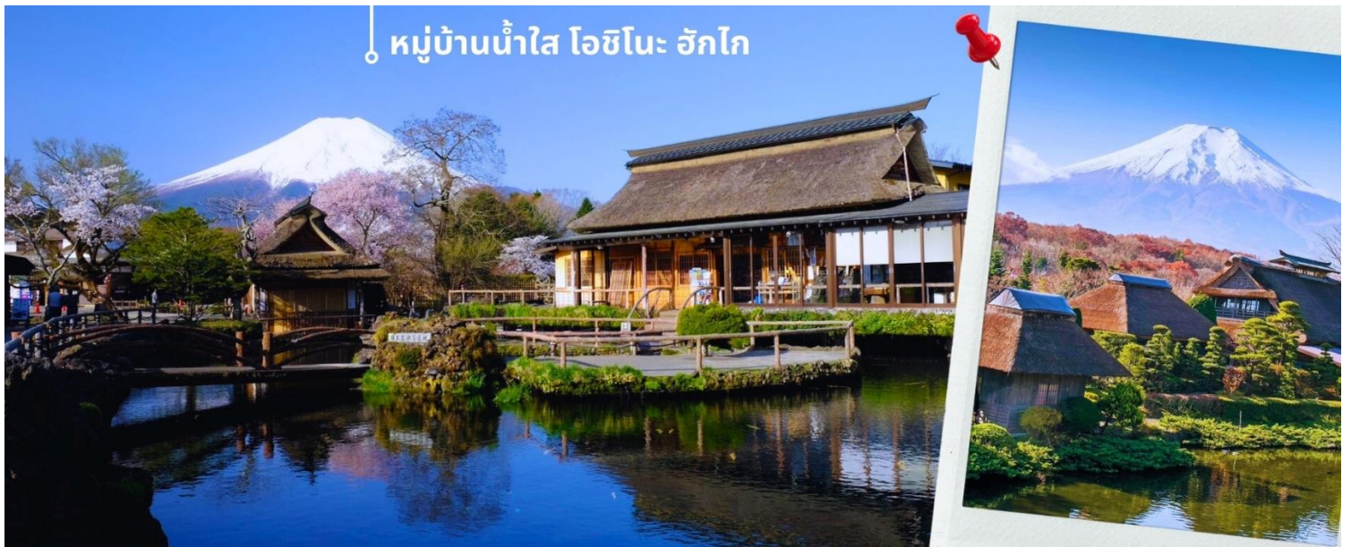
หมู่บ้านน้ำใส โอชิโนะ ฮักไก

พอสมควรแก่เวลานำท่านสู่ หมู่บ้านน้ำใส โอชิโนะ ฮักไก (Oshino Hakkai) ถือเป็นหมู่บ้านแห่งการท่องเที่ยวที่ยังคงความอุดมสมบูรณ์ของธรรมชาติเอาไว้ได้อย่างดีในหมู่บ้านมีบ่อน้ำใสที่เป็นน้ำที่ละลายมาจากหิมะบนภูเขาไฟฟูจิที่มีความสวยงามในระดับที่ว่าได้รับการขึ้นทะเบียนให้เป็นมรดกทางธรรมชาติในปีค.ศ. 1934 และได้รับคัดเลือกให้เป็นหนึ่งในภูมิทัศน์ทางน้ำที่งดงามในปีค.ศ. 1985 อีกด้วยและยังเป็นอีกหนึ่งสถานที่ที่เราสามารถมองเห็นวิวฟูจิด้วยหากวันนั้นเป็นวันที่ฟ้าเปิด