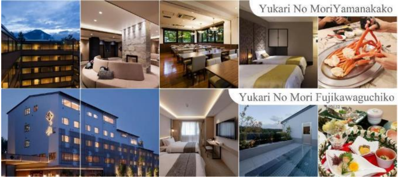
Yukari No Mori Yamanakako