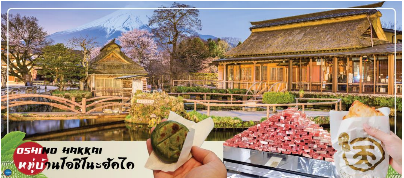
OSHINO HAKKAI หมู่บ้านโอชิโนะฮัคไค

เป็น ดอกบิโกเนีย, ดอกซินเนีย, ดอกซัลเวีย และดอกรัตเบเกีย นอกจากนี้ยังสามารถมองเห็นวิวของภูเขาไฟฟูจิได้อีกด้วย ภายในสวนมีจุดให้ถ่ายรูปมากมาย และยังมีสวนดอกไม้สไตล์อังกฤษที่มาพร้อมตัวละครมาสคอตสุดน่ารัก "Piter Rabbit English Gardent" และนอกจากนี้ยังมีคาเฟ่ไว้นั่งพักผ่อนชมวิวแบบชิลๆอีกด้วย