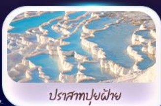
ปราสาทฟูไฟย