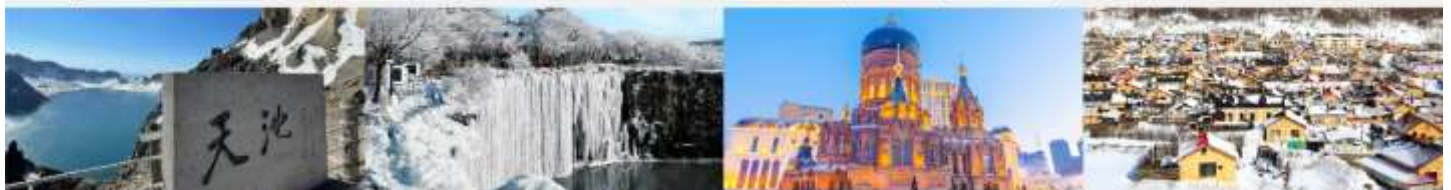
อุทยานแห่งชาติฉางโป๋ซาน