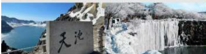
อุทยานแห่งชาติงามไปชาน