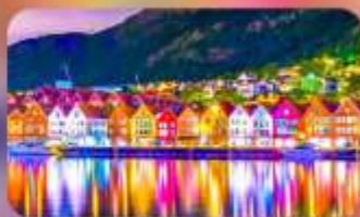
พิกเบอร์เก้น 1 คืน