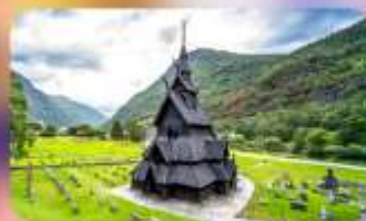
Unseen โบสถ์ Borgund Stave Church