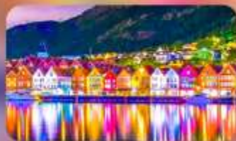
พิกเซอร์กัน 1 คืน