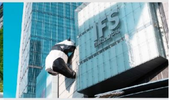
แพนด้ายักษ์ปีนตึก IFS