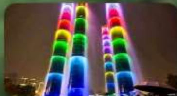
น้ำพุไม้ไฟ