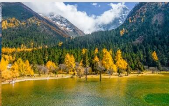
อุทยานแห่งชาติปี่ฝิ่งโกว