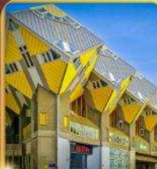
บ้านลูกเต่าโคกคูบัส