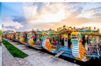
ล่องเรือมังกร