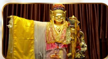
เทพทันใจจีเข้า