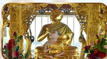
ขอพระพระอุปคุต ปางจกบาศรียัมา