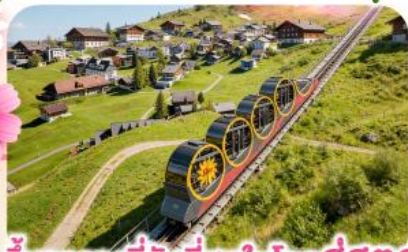
ขบวนรถไฟที่ชันที่สุดในโลกสู่สตุส

พิชิตยอดเขาชุนเนกกา 1 ในเขาที่สวยงามที่สุดเมืองเซอร์แมท