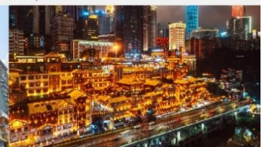
หงหยาดัง(ชมไฟยामคำคิ่น)