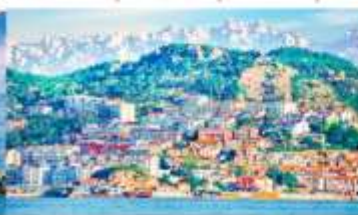
หมู่บ้านชาวประมงซาจื่อไฮว