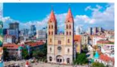
โบสถ์คริสต์เซนต์โมเคิล

*ทางบริษัทฯ ขอสงวนสิทธิ์ในการสลับโปรแกรมทัวร์ตามความเหมาะสมขึ้นอยู่กับสถานการณ์หน้างาน โดยคำนึงถึงผลประโยชน์ของลูกค้าเป็นสำคัญ