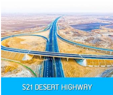
S21 DESERT HIGHWAY