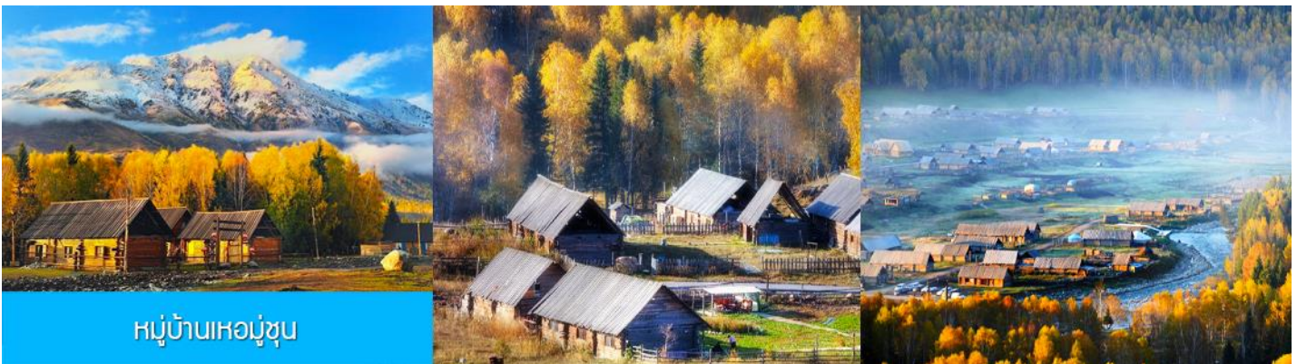
หมู่บ้านเหม่อู่ซุน

พักที่ SU TONG HOLIDAY HOTEL โรงแรมระดับ 4 ดาวท้องถิ่น หรือเทียบเท่าในเมืองบูเอ๋อจิน