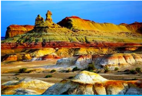
เมืองวูเอ๋อเหอ

ค่ำ รับประทานอาหารค่ำ ณ ภัตตาคาร (เมนูอาหาร 80 หยวน/หัว) (9) พักที่ XI BU WU ZHEN HOTEL ระดับ 4 ดาวท้องถิ่นหรือเทียบเท่าในเมืองวูเอ๋อเหอ