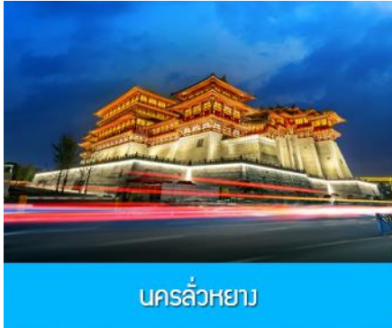
นครลั่วหยาง