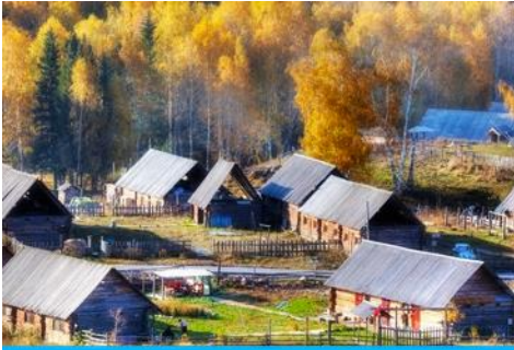
บ้านชนเผ่าทู่หว่า