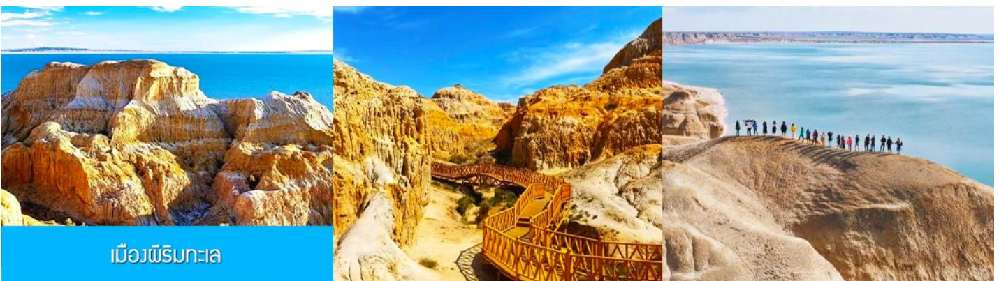
เมืองผีริมทะเล

เที่ยง รับประทานอาหารกลางวัน ณ ภัตตาคาร (เมนูอาหาร 80 หยวน/หัว) (2)