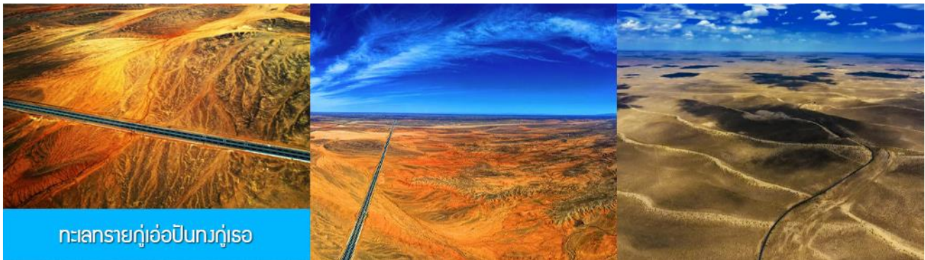
ทะเลทรายกุเอ้อปิ่นทงกุเอ้อ

เช้า บริการอาหารเช้า ณ ร้านอาหารในโรงแรมย่านสนามบิน (1)