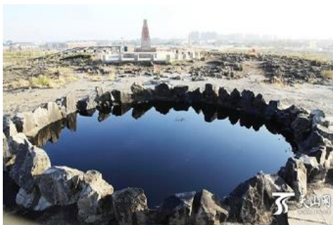
บ่อน้ำมินสีดำ

เที่ยง ระหว่างทางแวะรับประทานอาหารกลางวัน ณ ภัตตาคาร (เมนูอาหาร 80 หยวน/หัว) (11)