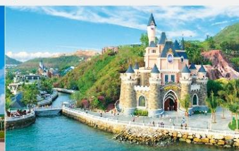
สวนสนุกวินวันเดอร์ส

*ทางบริษัทฯ ขอสงวนสิทธิ์ในการสลับโปรแกรมทัวร์ตามความเหมาะสมขึ้นอยู่กับสถานการณ์หน้างาน โดยคำนึงถึงผลประโยชน์ของลูกค้าเป็นสำคัญ