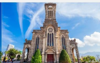
โบสถ์หินญาจาง