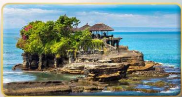
วิหารทานาห์ลือต