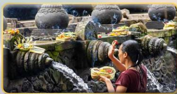
วัดน้ำพุศักดิ์สิทธิ์