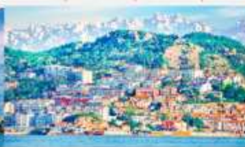
หมู่บ้านชาวประมงซาจื่อโฮว