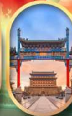
ถนนคนเดินเจียนเหมิน