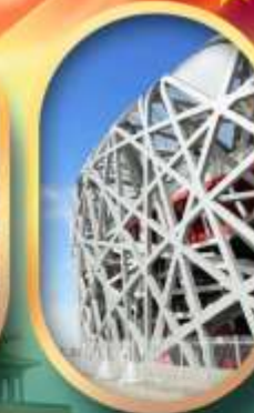
ผ่านชมสนามกีฬาฟาริงก