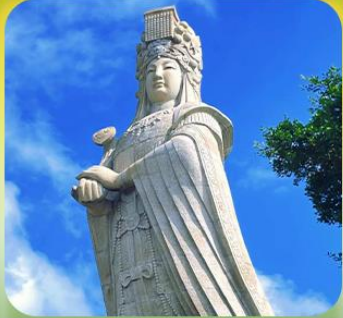
“เจ้าแม่ทับทิมหม่าโจ้ว”