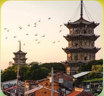
“เมืองโบราณฉวนโจว”