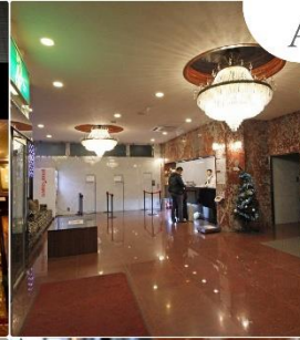
Asia Narita Hotel