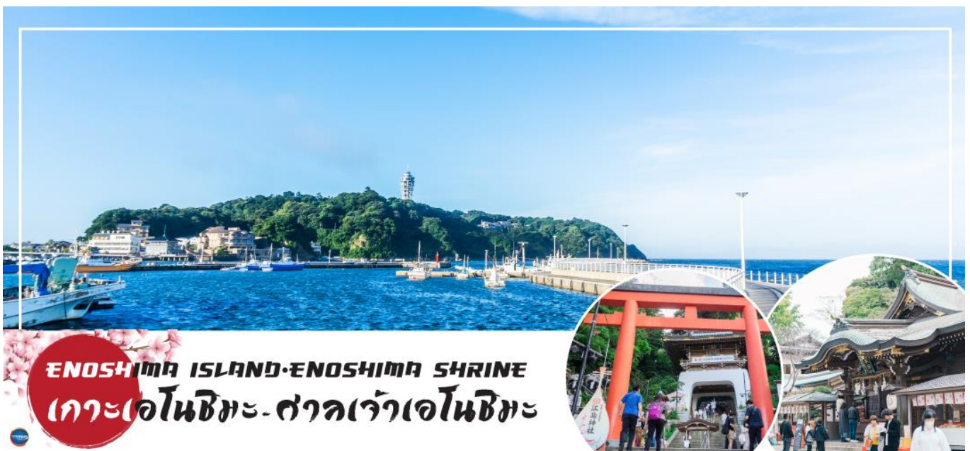
ENOSHIMA ISLAND · ENOSHIMA SHRINE เกาะเอโนชิมะ · ศาลเจ้าเอโนชิมะ

จากนั้นนำท่านสู่ ถนนเบนไซเท็น นากามิสะ (Benzaiten Nakamise Dori) ตั้งแต่ประตูโทริอินี้ไปจนถึงประตูโทริอิสีแดงที่หน้าประตูซุยกิงมงจะเรียงรายไปด้วยร้านอาหาร ร้านขายของที่ระลึก และเรียวกังเก่าแก่กว่า 40 ร้าน จนถึงหน้าประตูศาลเจ้าเอโนชิมะ และโดดเด่นด้วยประภาคารเอโนชิมะ ซี แคนเดิล อันโด่งดัง (ไม่รวมค่าขึ้นจุดชมวิวประมาณ 800 เยน/ท่าน)