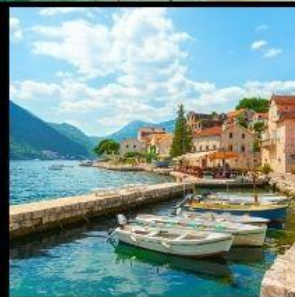
มอนเตเนโกร