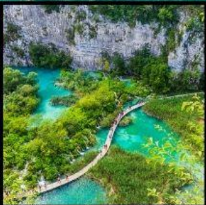
อุทยานแห่งชาติพลิตวิเซ่