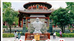
ศาลเจ้าแม่กวนอิมพันกร