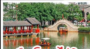
เมืองโบราณไท่ผิง