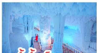
ถ้ำน้ำแข็งหลงกง

น้ำตกเต๋อเทียน - เทาชิงซิว - ชมดอกซากุระ เที่ยวสวนส้มกลางขุนเขา - เมืองโบราณไท่ผิง ถ้ำน้ำแข็งหลงกง - เมืองโบราณไท่ผิง ศาลเจ้าแม่กวนอิมพันกร - POP MART