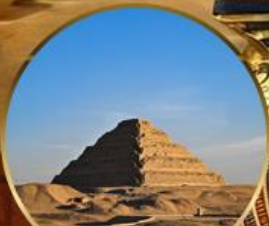
พีระมิดบันบันได