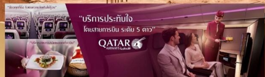
"บริการประทับใจ โดยสารการบิน ระดับ 5 ดาว"