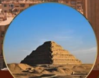
พีระมิดชั้นบันได