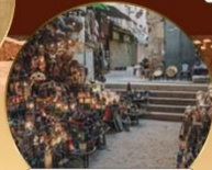
ตลาดข่านเอลคาลลี