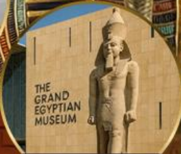
พีพีรภัณฑ์แกรนด์อียิปต์