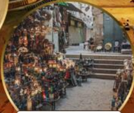
ตลาดบ้านเอลคาลิสี