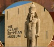
พิพิธภัณฑ์แกรนด์อียิปต์