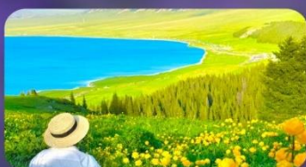
ทะเลสาบไซท์หลี่มู่