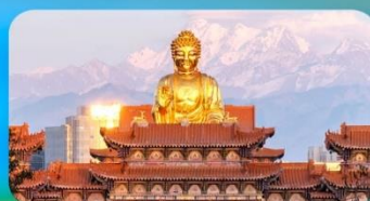
วัดพระใหญ่ทงกงชาน