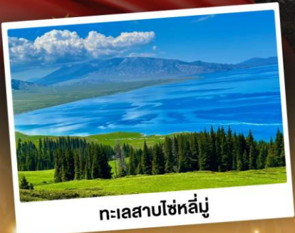
ทะเลสาบไซหลินู่