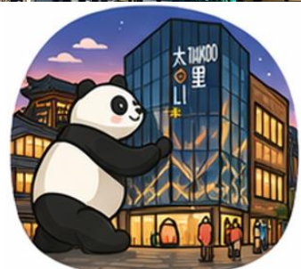
ถนนคนเดินไท่กู่หลี่ (Taikoo Li)

ที่พัก CHUNBO INT HOTEL เทียบเท่าหรือระดับ 4 ดาวท้องถิ่น