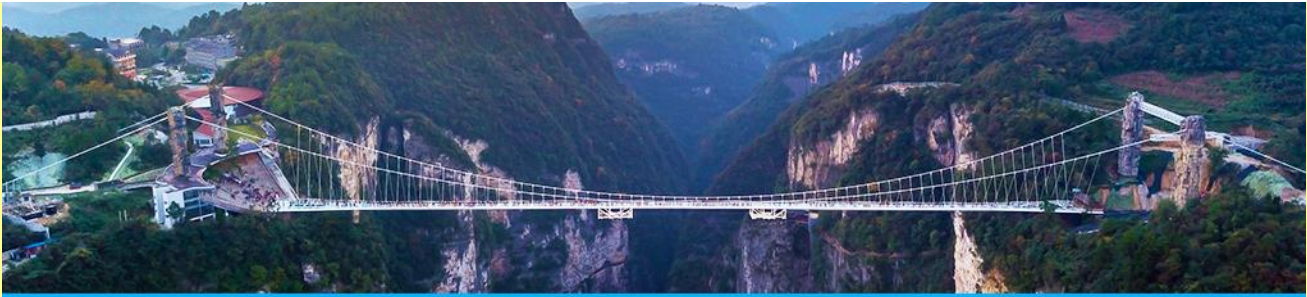
สะพานกระจากข้ามหุบเขาแกรนด์แคนยอน

โปรแกรมเที่ยวชมสะพานกระจากพร้อมหุบเขาแกรนด์แคนยอนจากเจียเจี้ย (ผู้เข้าร่วมขั้นต่ำ 15 ท่าน) ใช้เวลาประมาณ 2-3 ชั่วโมง (ขึ้นอยู่กับจำนวนนักท่องเที่ยวในแต่ละวัน) อัตราค่าบริการท่านละ 400 หยวนหรือ 2,000 บาท นำท่านเที่ยวชมสะพานกระจากที่สร้างครอบหุบเขาที่ยาวที่สุดในโลก ทำทหายความกล้าของท่านด้วยการเดินบนพื้นกระจากสีที่สามารถมองเห็นก้นเหวลึกที่อยู่เบื้องล่าง....อัตราค่าบริการรวม ค่าบัตรเข้าอุทยาน ค่ารถรับส่งภายในเขตอุทยาน ค่านำเที่ยวของไกด์ท้องถิ่น