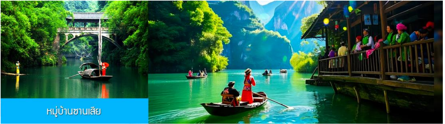
หมู่บ้านชาบเสีย

วันที่สอง เมืองหยีซาง-หมู่บ้านชานเสีย-เมืองจางเจียเจี๋ย- ไกด์นำเสนอ OPTIONAL TOUR ชุดชมการแสดงสุดอลังการ