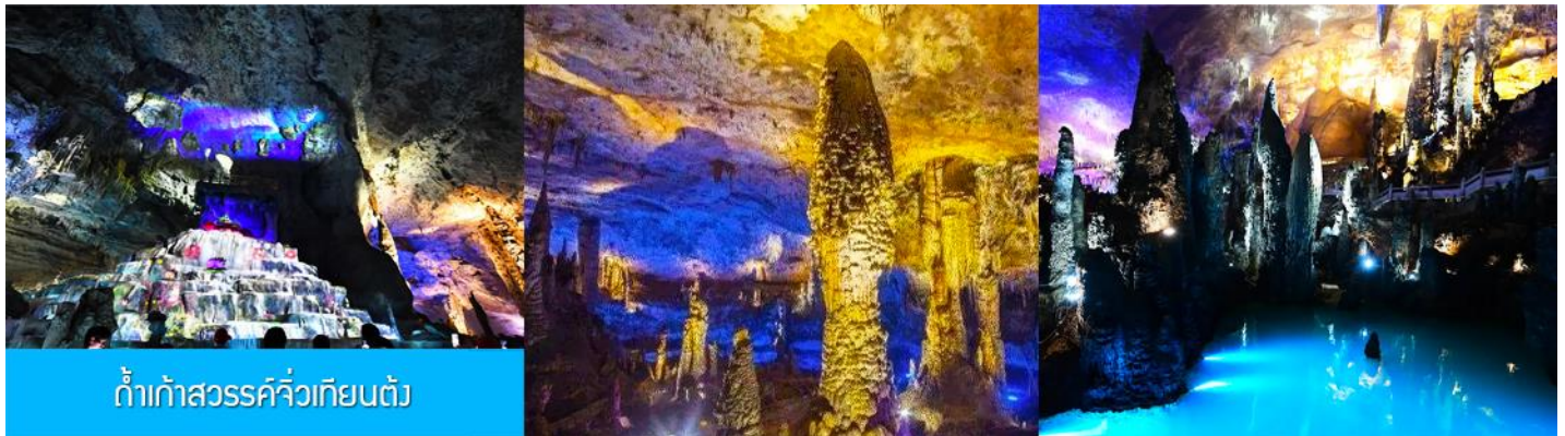
ถ้ำเก้าสวรรค์จิวเทียนตั้ง

พักที่ HANTING HOTEL ระดับ 4 ดาวห้องถิ่นหรือเทียบเท่าในเมืองจางเจียเจีย