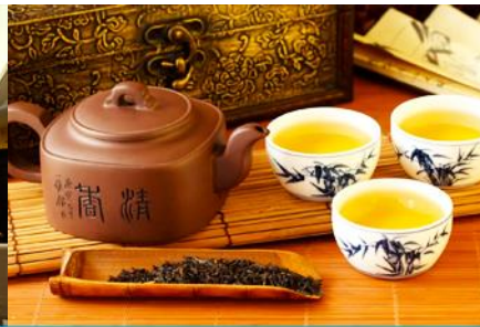
ศูนย์จำหน่ายผลิตภัณฑ์ใบชา