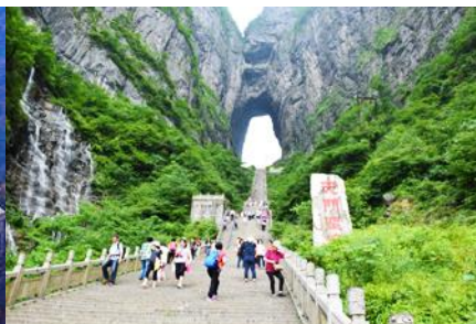
ประตูลำธาร