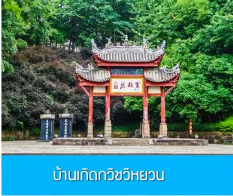
บ้านเกิดกวีชวีหยวน