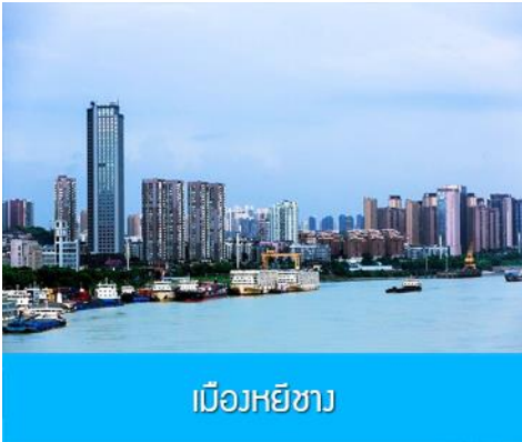
เมืองหยี่ชาง