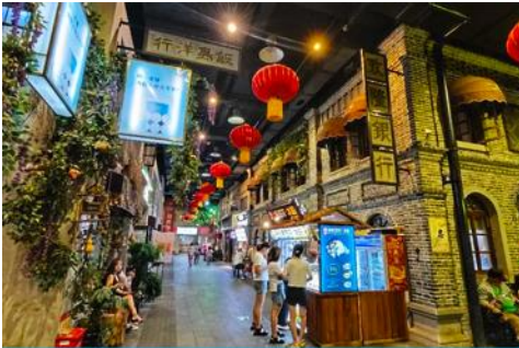
ถนนโบราณอันตง