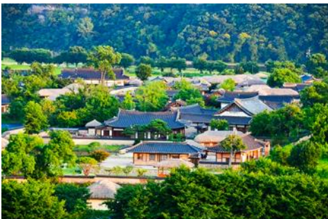
ศูนย์วัฒนธรรมเกาหลี

เช้า รับประทานอาหารเช้า ณ ห้องอาหารของโรงแรม (6)