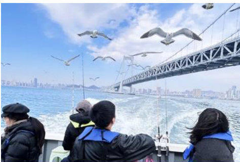
นั่งเรือใบออกทะเลลิ้นงนางนวล

ต่อด้วยนำท่านเที่ยวชมถนนรัสเซีย 俄罗斯风情街 ในอดีตที่นี่เป็นศูนย์ที่ตั้งของทำการเมืองต้าเหลียน ภายหลังได้กลายเป็นชุมชนของพ่อค้าและวิศวกรทางรถไฟชาวรัสเซีย บริเวณนี้จึงเต็มไปด้วยอาคารบ้านเรือนแบบตะวันตก(รัสเซีย) มากมาย นอกจากนี้ได้เก็บภาพที่มีพื้นหลังเป็นอาคารสถาปัตยกรรมตะวันตก ที่นี่ยังมีร้านค้าที่จำหน่ายสินค้าและของที่ระลึกที่นำเข้ามาจากรัสเซีย อาทิ ซ็อกโกแลต เหล้าวอดก้า ตุ๊กตารัสเซีย ฯลฯ