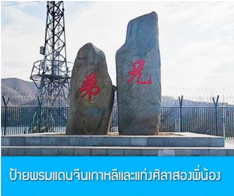
ป้ายพรมแดนจีนเกาหลีและแท่งศิลาสองพี่น้อง