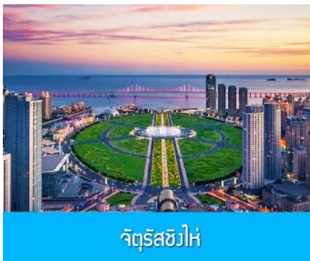
จัตุรัสชิงไห่

เช้า รับประทานอาหารเช้า ณ ห้องอาหารของโรงแรม (1)