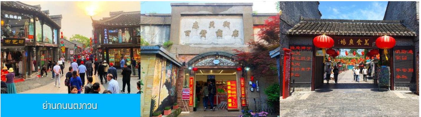
ย่านถนนตงกวน

หลังอาหารนำท่านเที่ยวชมเมืองต้าเหลียนเป็นเมืองชายฝั่งทะเลในมณฑลเหลียวหนิงที่อยู่ทางตอนเหนือของจีน ชม จัตุรัสชิงไห่ 星海广场 เป็นจัตุรัสขนาดใหญ่เป็นแลนด์มาร์คสำคัญของเมืองต้าเหลียน สร้างขึ้นเพื่อเฉลิมฉลองในโอกาสที่รัฐบาลอังกฤษคืนเกาะฮ่องกงในให้จีนในปี ค.ศ. 1997 ตั้งอยู่ชายฝั่งทะเลในเมืองต้าเหลียน เป็นจัตุรัสใจกลางเมืองที่ใหญ่ที่สุดในโลกและ เป็นแลนด์มาร์คของเมืองต้าเหลียน รายล้อมด้วยตึกระฟ้าที่ทันสมัย ภายในมีบ่อน้ำพุดนตรี ลานหญ้าขนาดใหญ่ และลานกว้างสำหรับจัดกิจกรรมกลางแจ้ง อาทิ เทศกาลเปียร์นานาชาติ การแข่งขันวิ่งมาราธอน งานแฟชั่นนานาชาติเมืองต้าเหลียน ฯลฯ