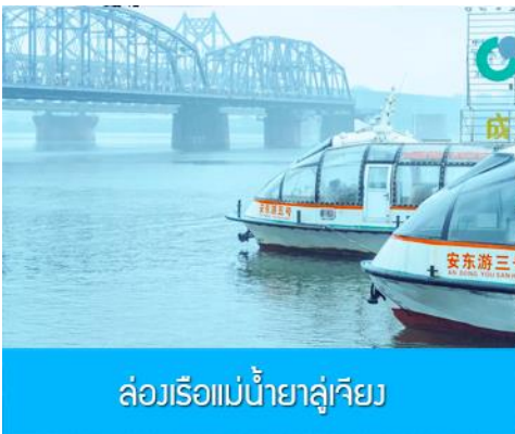
ล่องเรือแม่น้ำยาลูเจียง

หลังอาหารให้ท่านพักผ่อนตามอัธยาศัยในโรงแรม