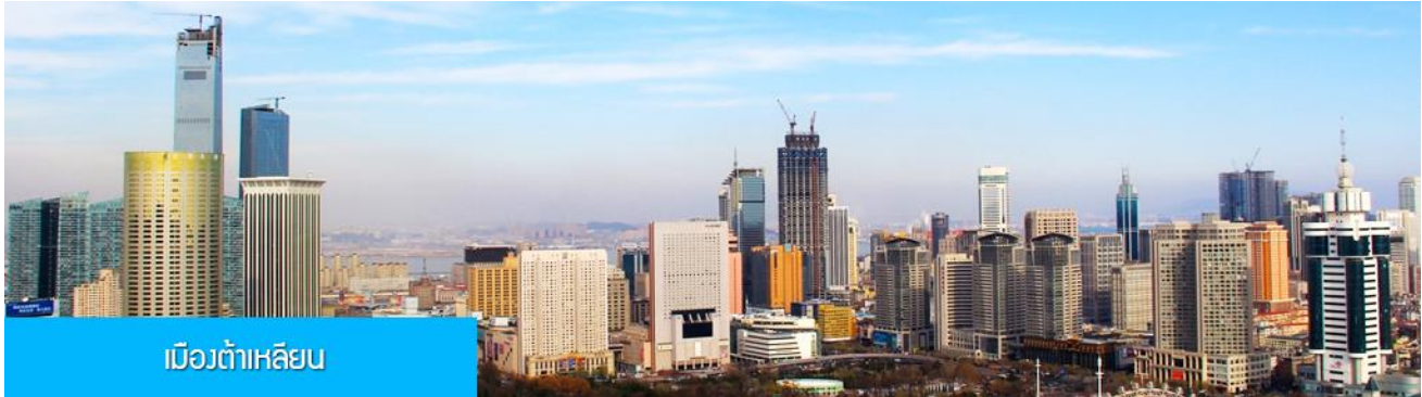
เมืองต้าเหลียน