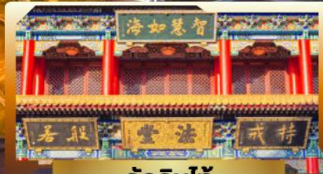
วัดจินไท่