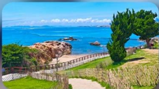
เกาะเสี่ยวมายเต๋า