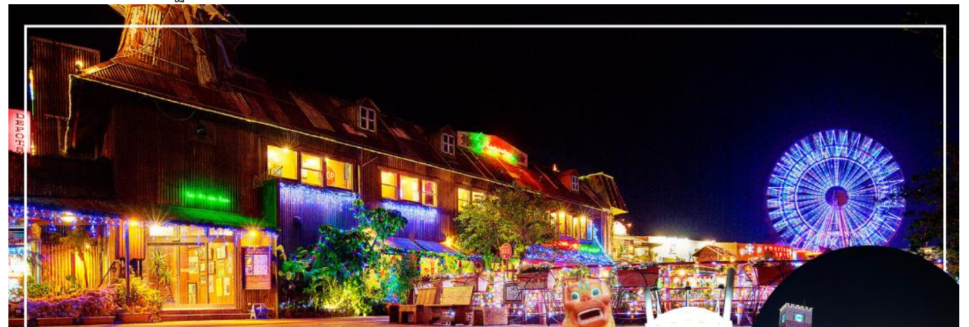
AMERICAN VILLAGE อเมริกัน วิลเลจ

จากนั้นนำท่านสู่ อเมริกัน วิลเลจ (American Village) (ใช้เวลาเดินทางประมาณ 50 นาที) ตั้งอยู่ในเมืองที่มีชื่อว่า ซาตัง อยู่ตอนกลางของโอกินาวา สร้างเลียนแบบแหล่งช้อปปิ้งย่านซานดิเอโกในประเทศสหรัฐอเมริกา ที่นี่เป็นแหล่งช้อปปิ้งที่มีสินค้าสารพัดหลากหลายสไตล์ให้ท่านได้เลือกสรร นอกจากนี้ยังมี