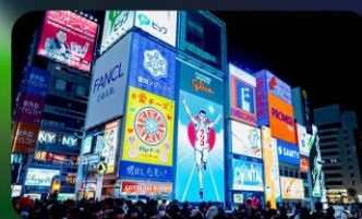
ซูปป์ซันโซบาชิ