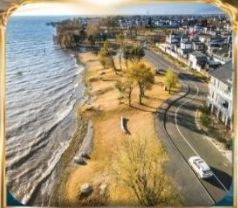
ทะเลสาบเอ๋อไห่ โค้งตัว S