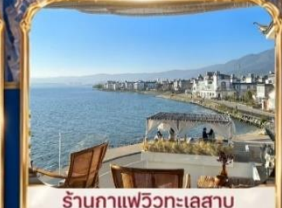
ร้านอาหารวิวทะเลสาบ BAN SHAN YUE (รวมค่าเช่า ไม้รวมเครื่องดื่ม และค่าเช่าเสื้อถ่ายรูป)