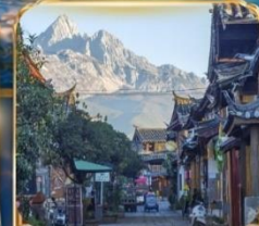
เมืองโบราณซูเหอ