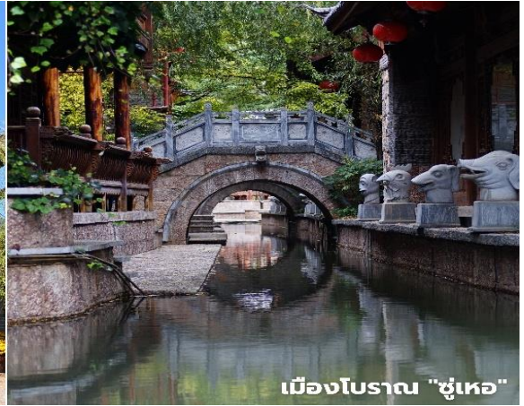
เมืองโบราณ "ซูเหอ"

Option : โชว์ Romance Lijiang หรือรักนิรันดร์ลี่เจียง ราคา 400 หยวน/ท่าน