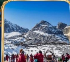
ภูเขาหิมะมังกรหยก +กระเช้าใหญ่