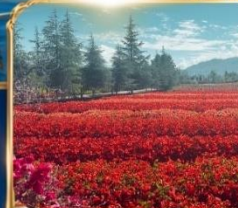
สวนดอกไม้ HUA YU MU CHANG