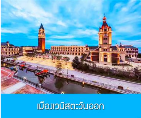
เมืองวีนิตะวันออก