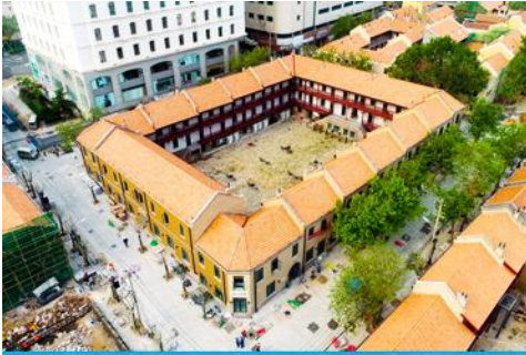
เมืองเก่าเยอรมัน ตรอกกว้างซิงหลี่