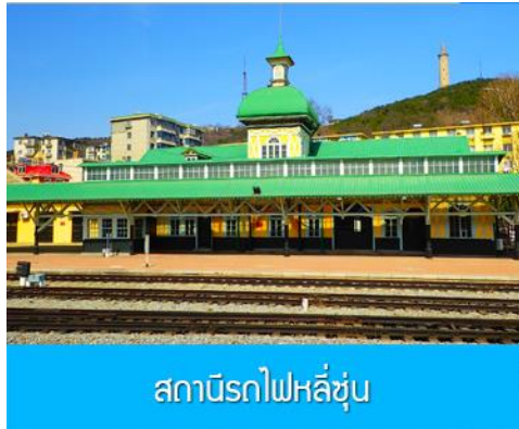
สถานีรถไฟลี่ซุ่น

เรือท่องเที่ยวนำคณะเดินทางถึงท่าเรือเมืองต้าเหลียน นำท่านขึ้นรถบัสเพื่อเดินทางสู่ตัวเมืองต้าเหลียน เช้า รับประทานอาหารเช้า ณ ห้องอาหาร (7)