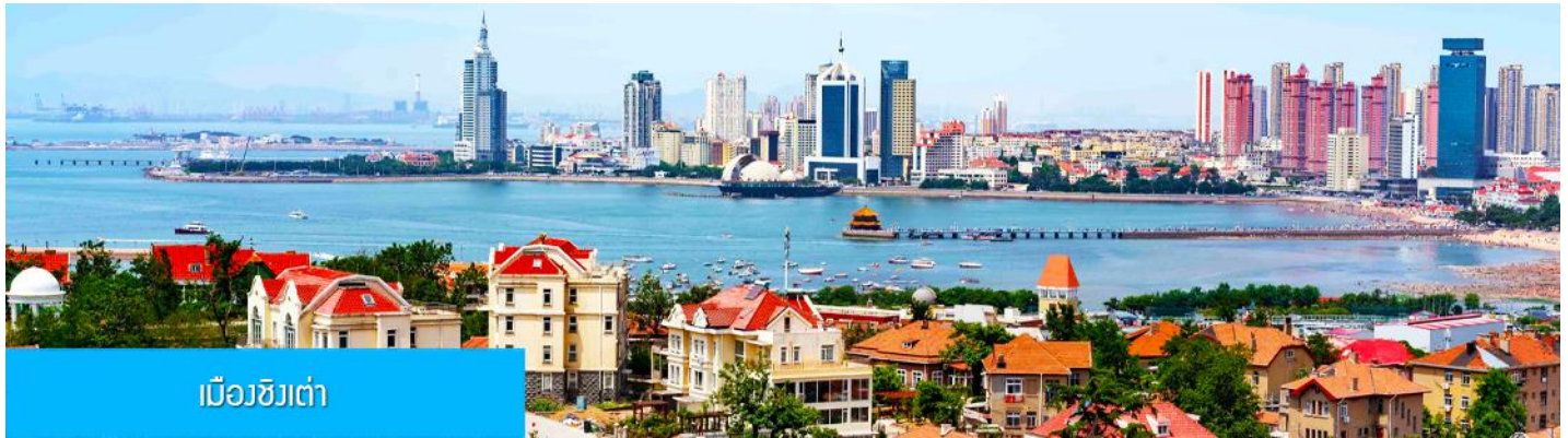
เมืองชิงเต่า