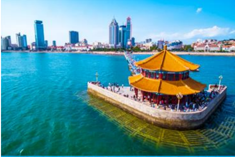
สะพานเคียนเฉียว

เช้า รับประทานอาหารเช้า ณ ห้องอาหารของโรงแรม (1)