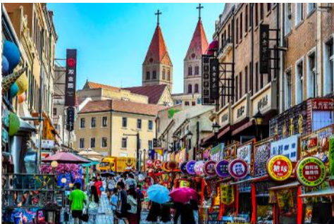
ถนนวาชาน

หลังอาหารเช้าท่านเดินทางชม สะพานจ้านเฉียว 栈桥 เป็นแลนด์มาร์กแห่งประวัติศาสตร์คู่เมืองชิงเต่า สร้างเมื่อปี ค.ศ.1891 มีลักษณะเป็นสะพานหินทอดยาวกว่า 440 เมตรสู่ทะเล ปลายสะพานมีศาลา ทรงแปดเหลี่ยมสีแดงที่โดดเด่น ซึ่งเป็นสัญลักษณ์บนฉลากเปียร์ชิงเต่า ขึ้นชื่อเรื่องวิวสวย รับลมทะเล ให้ท่านเก็บภาพบรรยากาศ