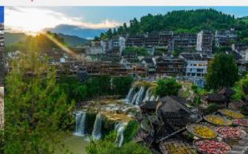
หมู่บ้านโบราณฟูหรงเจิน