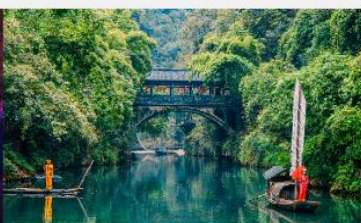
หมู่บ้านซานเสีเหรินเจีย