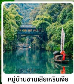
หมู่บ้านชาวน้ำร้อนเจีย