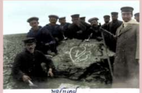
พจนานุกรม

พระองค์ทรงฉาย พระรูป (ถ่ายภาพ) ณ จุด North Cape