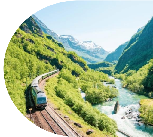
รถไฟชมวิว

นำท่าน นั่งรถไฟสายโรแมนติก “ฟลัมสบาน่า” จาก เมืองฟลัม สู่ เมืองไมร์ดัล (Flamsbana Railway from Flam to Myrdal) เส้นทางรถไฟที่โด่งดังที่สุดของประเทศนอร์เวย์ นักท่องเที่ยวจะได้ลัดเลาะไปตาม หุบเขาที่สวยงามของประเทศนอร์เวย์ โดยรถไฟจะวิ่งผ่าน อุโมงค์จำนวน 20 แห่ง โดยมีอุโมงค์ 18 แห่ง ได้ใช้แรงงานคนขุด ซึ่งระหว่างทางท่านจะได้ชื่นชมกับทัศนียภาพอันงดงามที่ธรรมชาติสรรสร้างแสนน่าประทับใจของหุบเขาอันสูงชัน และธารน้ำแข็งกลาเซียร์ แห่งฟยอร์ด ไปจนถึงเมืองไมร์ดัล (Myrdal) ในระหว่างทางที่นั่งรถไฟ นักท่องเที่ยวยังจะได้หยุดชมความสวยงามของ น้ำตกจอสฟอสเซ่น (Kjosfossen) อีกหนึ่งจุดท่องเที่ยวที่มีความสวยงามและได้รับความนิยมจากนักท่องเที่ยวเป็นอย่างมาก น้ำตกมีความสูงประมาณ 225 เมตร ส่วนน้ำในน้ำตกนั้นไหลมาจากทะเลสาบบนเทือกเขาชื่อทะเลสาบเรนนี กาวีทเน็ท (Reinungvatnet) และทะเลสาบเซลเทิฟวึทเน็ท (Seltuftvatnet) หลังจากนั้นขึ้นต่อไปตลอดเส้นทางจน **รอบของรถไฟอาจเปลี่ยนแปลงได้ตามความเหมาะสม กรณีไม่สามารถขึ้นรถไฟได้ ไม่ว่าจะกรณีใดก็ตาม ทางบริษัทขอสงวนสิทธิ์ไม่สามารถคืนค่าใช้จ่าย ไม่ว่าส่วนใดส่วนหนึ่งให้กับท่านได้ทุกกรณี เนื่องจากการชำระล่วงหน้ากับผู้แทนเรียบร้อยแล้วทั้งหมด **