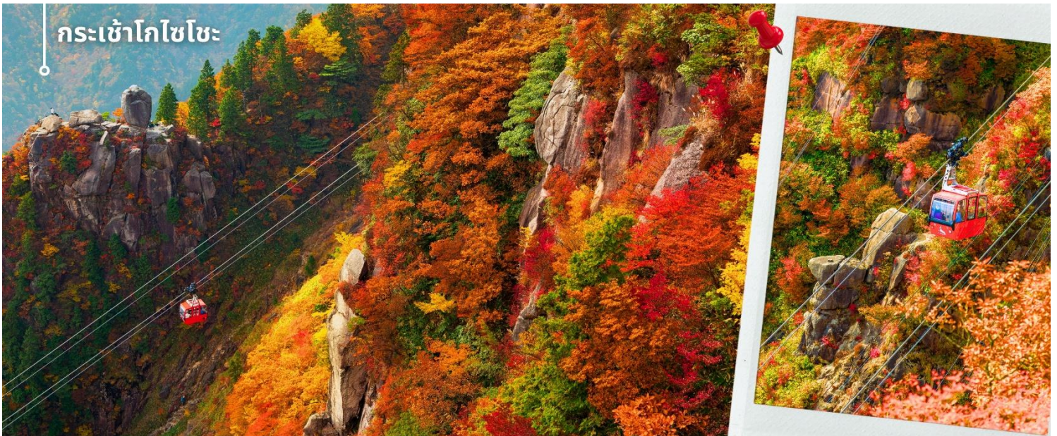
**การเปลี่ยนสีของใบไม้ ขึ้นอยู่กับสายพันธุ์และสภาพอากาศ**

หลังรับประทานอาหารเช้า พาท่านเดินทางสู่จังหวัดมิเอะ นำท่าน นั่งกระเช้าโกโซโซะ (รวมค่ากระเช้า) เพื่อพาท่านเดินทางขึ้นชมวิวใบไม้เปลี่ยนสี บนภูเขาโกโซโซะ ซึ่งเป็นหนึ่งในกระเช้าที่มีระยะทางยาวและสามารถชมวิวได้อย่างกว้างไกล ตัวกระเช้าเคลื่อนตัวผ่านแนวภูเขาและหุบเขา เปิดมุมมองแบบพาโนรามาให้เห็นผืนป่าด้านล่างอย่างชัดเจน ตลอดเส้นทาง ในช่วงฤดูใบไม้ร่วง ระหว่างการนั่งกระเช้า ท่านจะได้สัมผัสความงดงามของใบไม้เปลี่ยนสีที่ปกคลุมทั่วทั้งภูเขา โดยสามารถมองเห็นการไล่ระดับสีตามความสูงของพื้นที่ ตั้งแต่บริเวณยอดเขาที่เริ่มเปลี่ยนสีก่อน ไหลลงมายังเชิงเขาอย่างต่อเนื่อง พื้นที่บริเวณนี้ประกอบด้วยไม้หลายชนิด ที่ให้ทั้งสีแดง โทนเหลืองทอง รวมถึงเฉดสีส้มและน้ำตาลอ่อน เมื่อสีสันทเหล่านี้ผสมผสานกันเกิดเป็นภาพทิวทัศน์ที่มีมิติ สวยงาม และเปลี่ยนแปลงไปตามระดับความสูงอย่างเป็นธรรมชาติ ท่านสามารถเดินชมเส้นทางธรรมชาติและจุดชมวิวด่าง ๆ เพื่อสัมผัสบรรยากาศของภูเขาและชมทิวทัศน์ของผืนป่าหลากสีได้อย่างใกล้ชิด