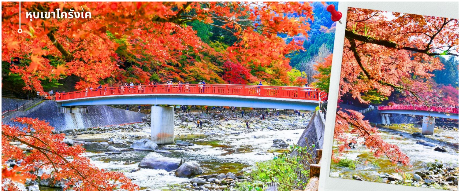
หุบเขาโครังเค

หลังรับประทานอาหารเที่ยงนำท่านเดินทางสู่ หุบเขาโครังเค (Korankei Gorge) ตั้งอยู่ในเมืองโทโยตะ เป็นหนึ่งในจุดชมใบไม้เปลี่ยนสีที่มีชื่อเสียงที่สุดแห่งหนึ่งของญี่ปุ่น โดดเด่นด้วยต้นเมเปิ้ลจำนวนมากที่ปลูกเรียงรายตลอดแนวแม่น้ำโทโมเอะ ทำให้เมื่อถึงฤดูใบไม้ร่วง พื้นที่ทั้งหุบเขาจะถูกแต่งแต้มด้วยสีแดงสด ส้ม และเหลืองอย่างงดงาม ไฮไลท์สำคัญของที่นี่คือ สะพานแดงไทเก็ตสึเคียว (Taigetsukyo Bridge) สะพานไม้สีแดงที่ทอดข้ามสายน้ำใจกลางหุบเขา ซึ่งกลายเป็นจุดชมวิวและถ่ายภาพที่มีชื่อเสียงมากที่สุดของโครังเค โดยสีแดงของสะพานจะตัดกับสีส้มของใบไม้เปลี่ยนสี และสายน้ำเบื้องล่างอย่างโดดเด่น สร้างภาพทิวทัศน์ที่มีเอกลักษณ์และงดงาม บริเวณโดยรอบมีเส้นทางเดินเลียบบแม่น้ำและจุดชมวิวหลายแห่ง ให้ท่านสามารถเดินชมธรรมชาติได้อย่างใกล้ชิด พร้อมสัมผัสบรรยากาศที่ร่มรื่นและเงียบสงบ ความหนาแน่นของต้นไม้หลากชนิด และไม้ผลัดใบอื่น ๆ ที่เปลี่ยนสีพร้อมกัน ทำให้เกิดภาพทิวทัศน์ที่มีมิติและสีสันสวยงามไปทั่วบริเวณ ให้ท่านได้อิสระเก็บภาพความสวยงามตามอัธยาศัย