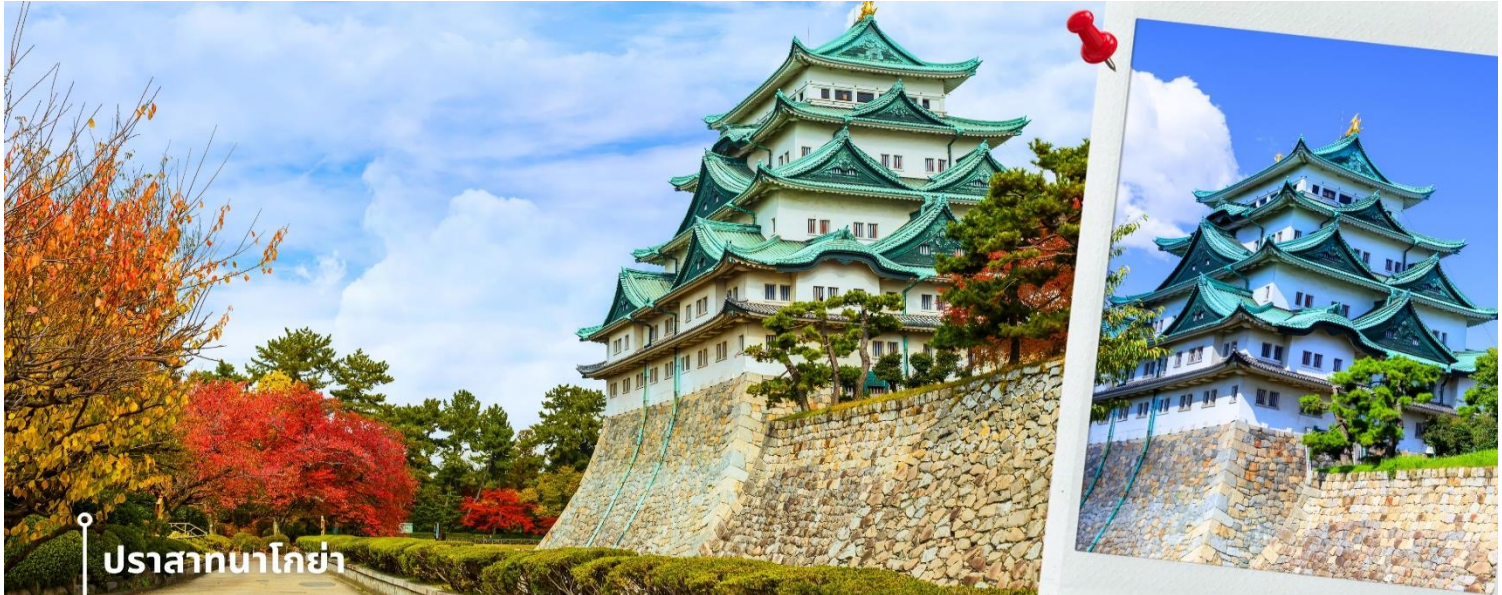
ปราสาทโกย่า

น้ำ และสวนที่ได้รับการดูแลอย่างดี ภายในมีการจัดแสดงนิทรรศการเกี่ยวกับประวัติศาสตร์และวิถีชีวิตในอดีต แม้ตัวปราสาทหลักจะได้รับความเสียหายจากสงครามและอยู่ระหว่างการบูรณะ แต่ยังคงเป็นแหล่งท่องเที่ยวสำคัญที่สะท้อนความยิ่งใหญ่และคุณค่าทางวัฒนธรรมของญี่ปุ่นได้อย่างชัดเจน ให้ท่านได้เดินชมและเก็บภาพความงดงามตามอัธยาศัย