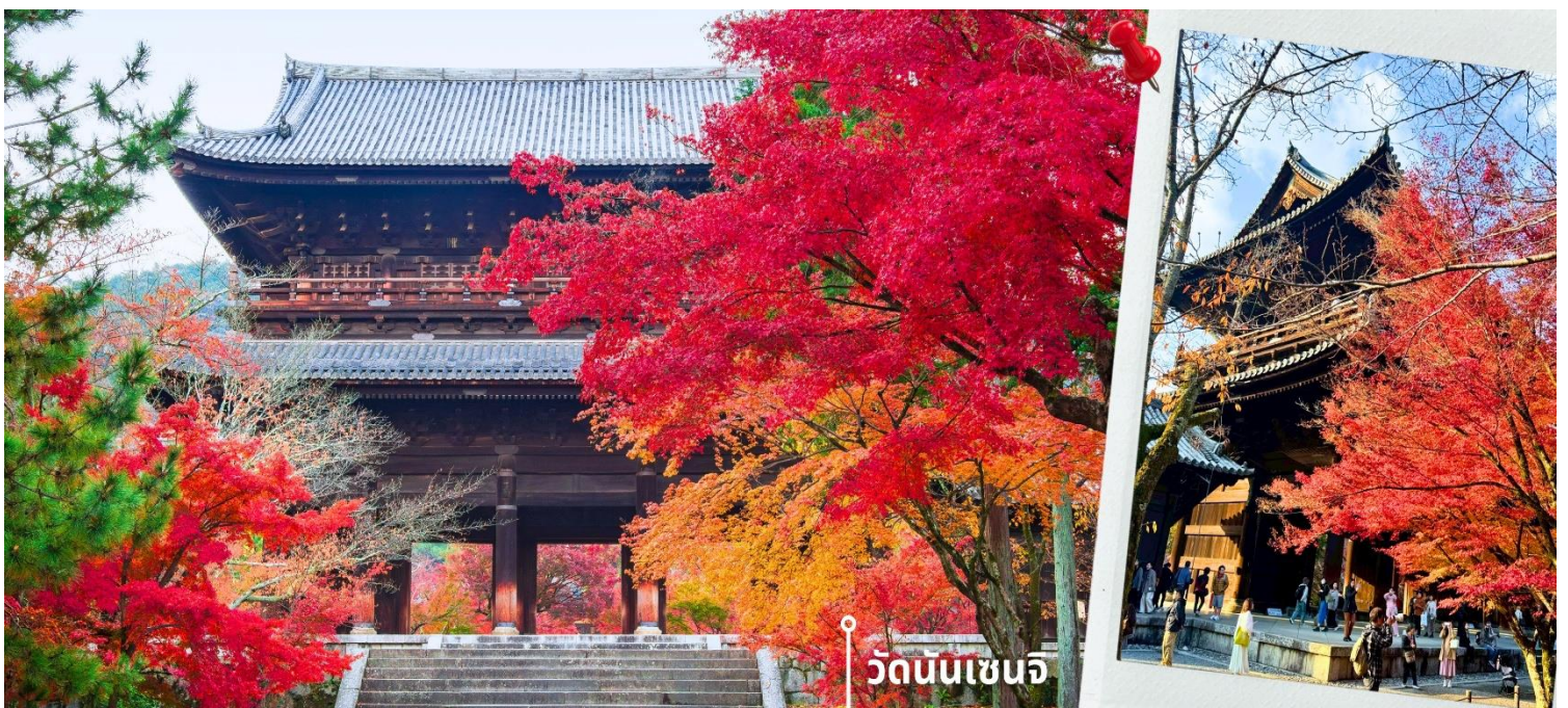
วัดนันเซนจิ

รับประทานอาหารเช้า ณ ภัตตาคาร (2) เมนูพิเศษ เซ็ต ชาบู ชาบู สไตล์ญี่ปุ่น